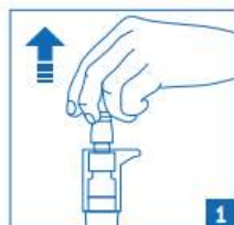
1. Odstranite pokrovček iz aplikatorja.

V oko vkapajte 1 – 2 kapljici ter nekajkrat pomežiknite, da se raztopina enakomerno porazdeli po površini očesa. Ne vsebuje konzervansov, zato kapljice niso škodljive za uporabo v očesu.