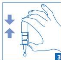
3. Obrnite plastenko navzdol in aktivirajte pumpico do pojava prve kapljice.